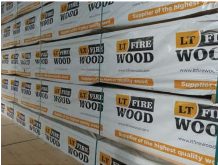
Didžioji UAB „LTF gamyba“ produkcijos dalis iš Anykščių keliauja į Australiją.