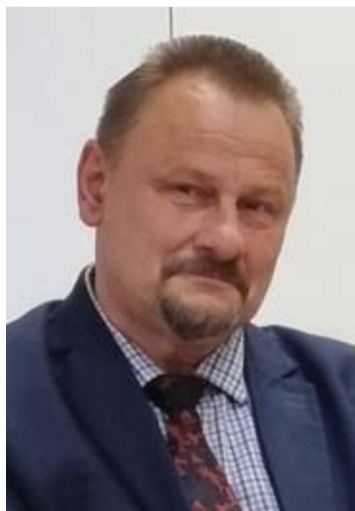
Anykščių rajono savivaldybės meras Sigutis Obelevičius akcentavo saugomų zonų svarbą rajono regioninio parko planavimo schema.